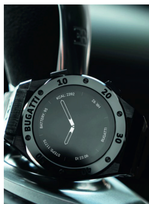
HBJO 05 JUIN 2021

Bugatti présente trois montres connectées.