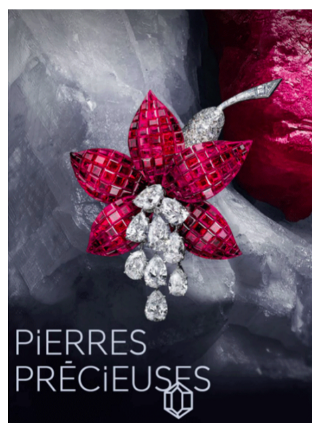
HBJO 03 JUIN 2021

Bugatti présente trois montres connectées.