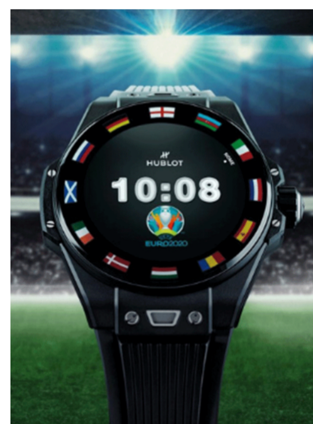
HBJO 01 JUIN 2021

« Pierres précieuses, des minéraux aux bijoux », l'exposition Van Cleef & Arpels.